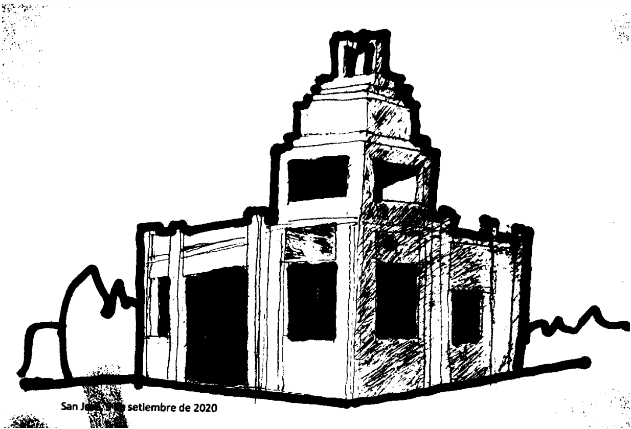
Croquis. Arquitecto Carlos Diana

Comisión de Patrimonio Departamental de San José Espacio Cultural San José - 18 de Julio 509 - San José de Mayo San José - Uruguay CP. 80.000 - Telefax: 43431780 - e.mail: comisiondepatrimoniosj@gmail.com