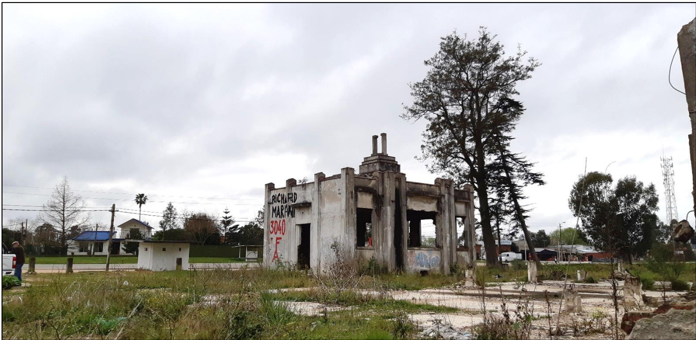
Estado Actual Del Edificio Fachada Posterior

En esta edificación se observan detalles constructivos, de diseño como molduras en la parte inferior de los aleros y la linterna que corona el edificio, destacándose algunos materiales nobles como el mármol en los escalones de acceso y los pisos de baldosa calcárea con su particular diseño.